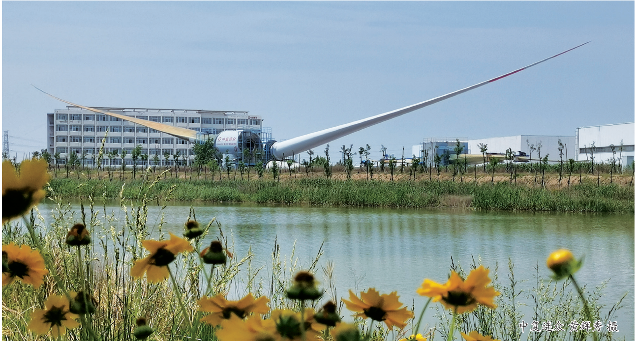
中复连众 黄辉秀 摄