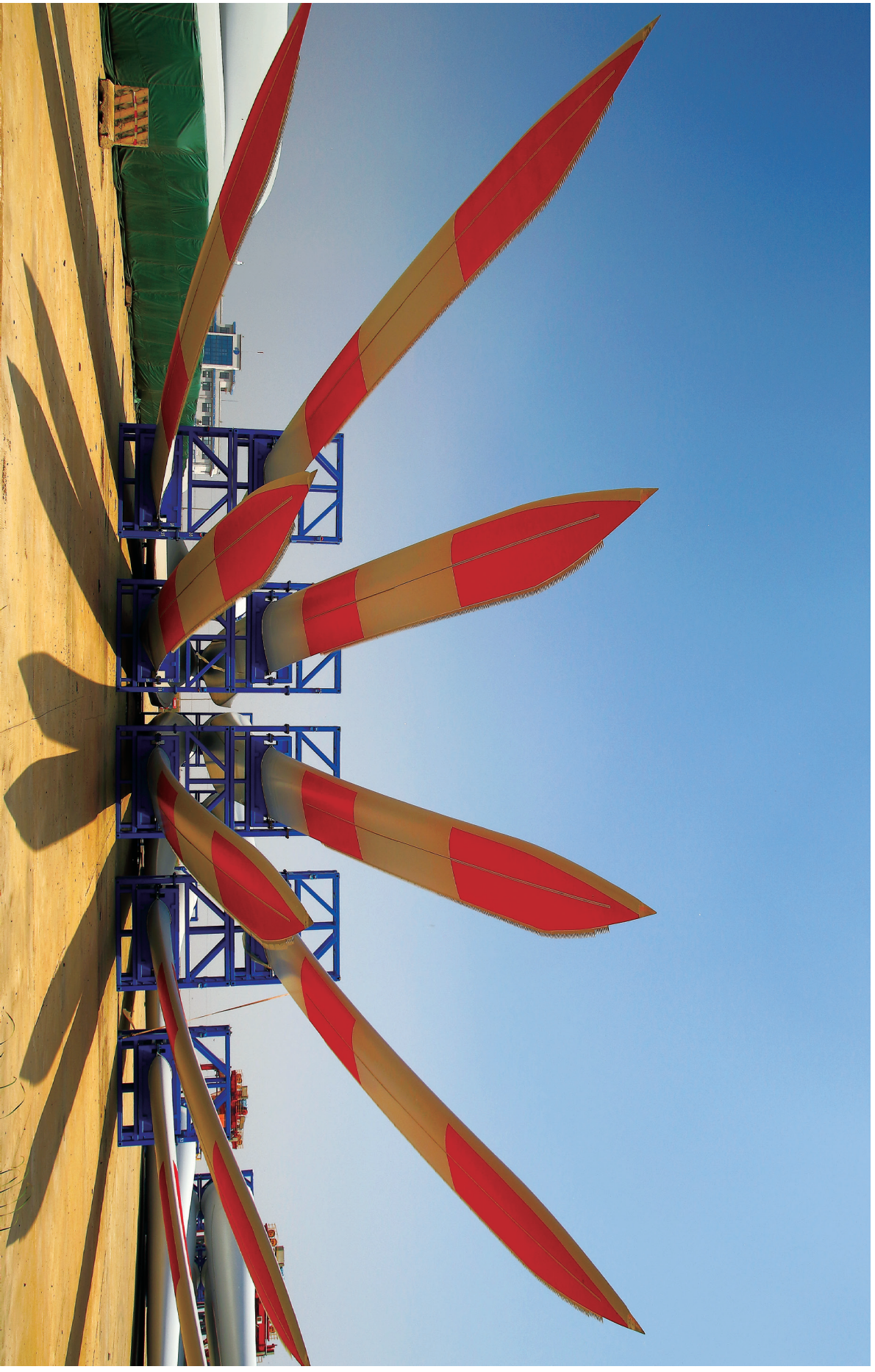
中复连众 LZ67-4.X 叶片交付